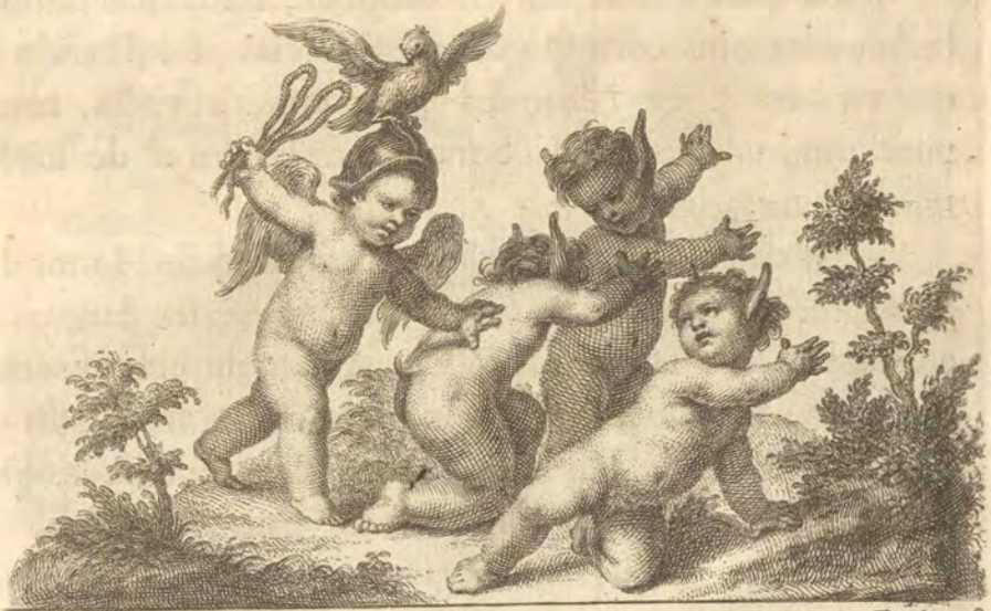
Ant. Gonz. z inv. t

recida, y dilatada série ! Apueste desde luego duraciones tu vida con sus mas sólidas y perfectas obras ; y sea tambien sin que se rompa el lazo, que une y estrecha las dos grandes almas que quiso igualar el Cielo con esclarecidos dotes, para bien nuestro, prosperidad de España, y admiracion del Mundo. Estos son y serán siempre los fervorosos votos de nuestros reconocidos deseos. ; O permita la Providencia, que se aumenten! O permita su bondad extraordinaria , que se cumplan!