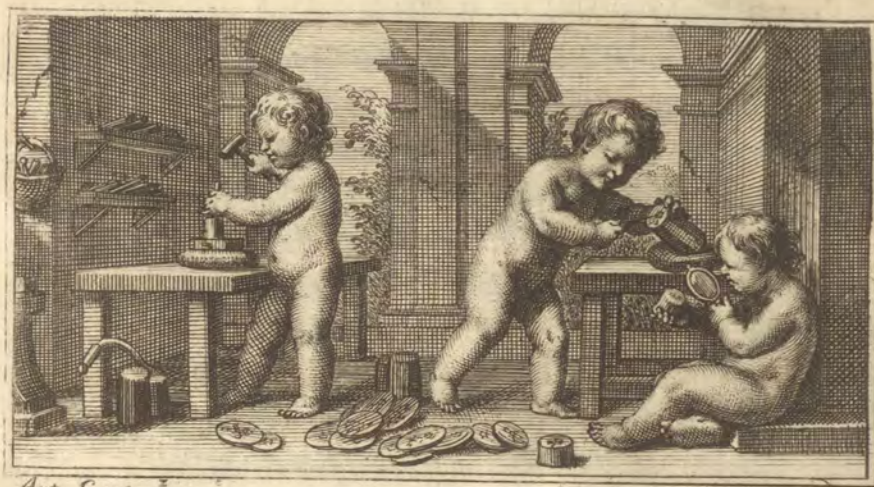
Ant. Gonz. inc.