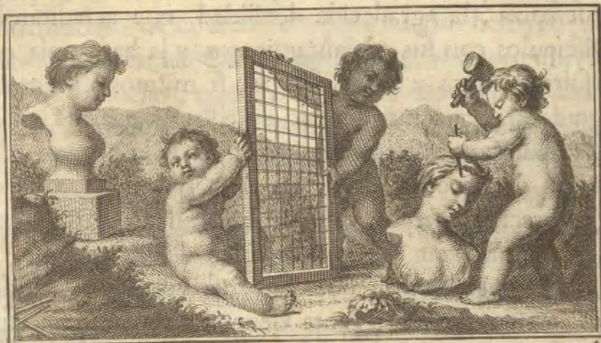
Ant. Gonz. inv.