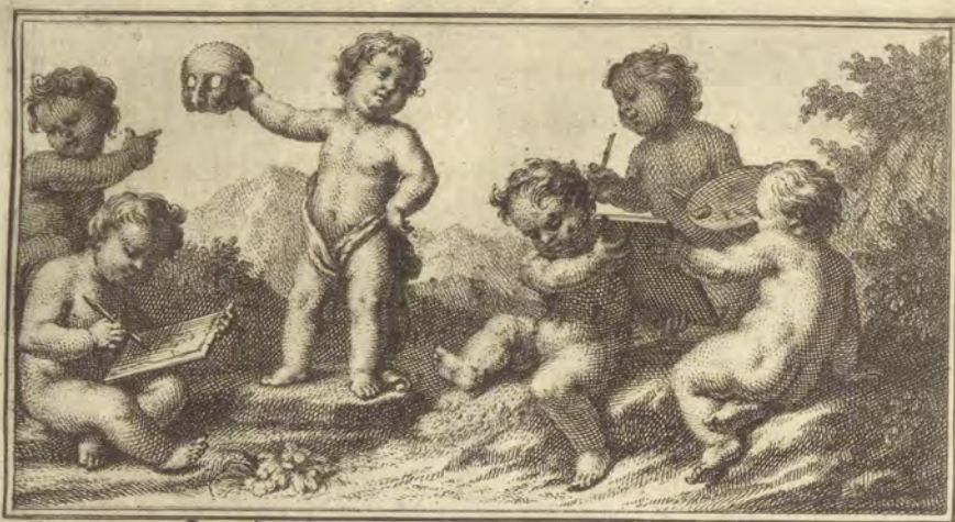
Ant. Gonz. o inv. o