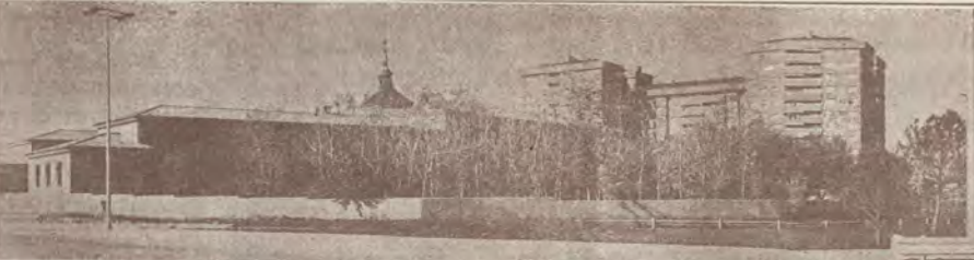
En el alto residencial de la avenida de la Paz se firma la pila de muerte para el contrato de las Reparadoras. Ahora, a construir.

Si Dios no lo remedia, torres de pisos en vez de 15.000 m 2 de concreto