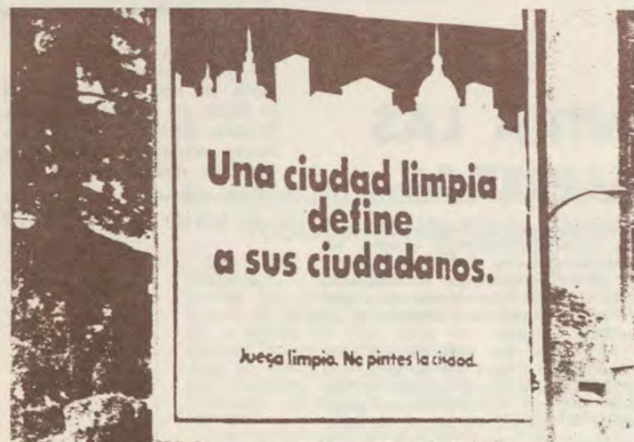
No basta con pedir juego limpio. Hay que dar también soluciones que sustituyan a la pintada.

zos y un gran espacio en blanco en el centro. Ahí se «pinta», con lo que la pintada se planta sobre un cartel y no maltrata de un modo irremediable los muros. Pero hay pequeños partidos o grupos sindicales de ocasión que quieren plasmar mensajes de urgencia y no pueden permitirse el lujo ni de tener carteles como los que citamos. Ante estos casos parecen existir dos soluciones: