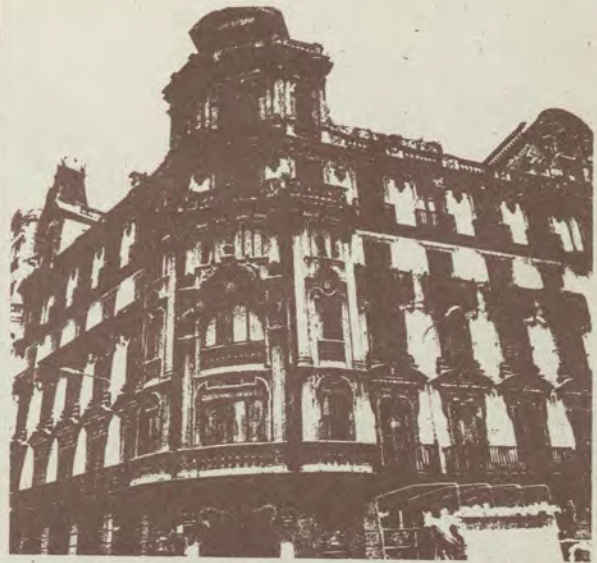
Frente al Palacio de las Cortes.

El patrimonio urbanístico de Madrid se empobrece a marchas forzadas, y las antiguas edificaciones cargadas de historia y de una característica arquitectura dan paso a una nueva ciudad más sofisticada e impersonal, menos admirable, común a cualquier capital de nueva planta. Todas las casas que mostramos en esta página están amenazadas de derribo, según solicitud presentada en el Colegio de Arquitectos. Ante la gravedad de la situación, este organismo profesional llama la atención, y el lunes, a las siete de la tarde, y hasta el 15 de febrero, celebrará una muestra gráfica en su sede de Barquillo, 12, para protestar de alguna forma contra la sistemática destrucción de la Villa hermosa y noble que antaño fue Madrid.