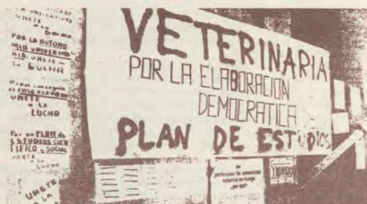
Una pared llena de mensajes. Pero no son indelebles. Al cabo de un cierto tiempo pueden eliminarse. Lo de las pintadas plantea más problemas.