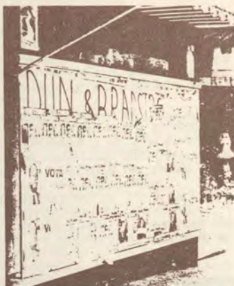
En la Gran Vía, bajo los carteles electorales permanece aún un ejemplo de pintada. En vez de realizarla directamente sobre un soporte vacío, sus autores pegaron un gran papel sobre el cristal y pintaron encima del papel. La pintada puede así «civilizarse».

Porque el papel se puede despegar. Y aunque no se quite, el tiempo se encarga de acabar con él. Pero la pintada permanece afeando la ciudad de un modo definitivo. ¿Es posible conseguir que toda la manifestación político-mural se canalice a través de los carteles? En principio, no. Las campañas organizadas pueden encargarse con tiempo a una imprenta. Pero existen las campañas de urgencia. Algunos partidos y centrales sindicales han salido ya a la calle con carteles con sus símbolos impre-