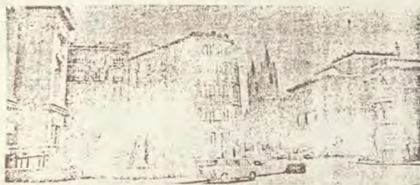
Los conjuntos urbanos de Madrid se deben conservar a todo trance. Su reforma interior debe ir aparejada a las exigencias de los tiempos. En el centro de la foto vemos un edificio de estilo isabelino cuyo interior ha sido ya acondicionado debidamente. Al fondo, la Iglesia de los Jerónimos

Los locales de la Exposición se encontrarán abiertos al público todos los días hasta el último día de mes, excepto sábados, de diez de la mañana a las dos de la tarde y de cinco a ocho. La entrada es gratuita. ABC 15-4-77