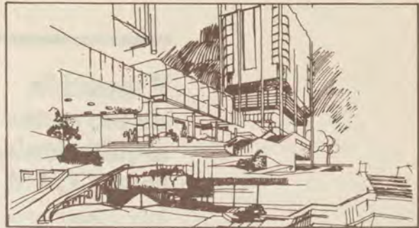
Uno de los conjuntos presentados

La composición general del proyecto gira en torno a un intento de coordinación de las distintas partes del edificio que —aunque por necesidades de organización funcional— tienen accesos a instalaciones totalmente independientes, su entronque relativo dentro del conjunto se