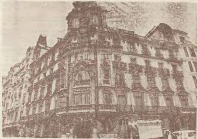
Uno de los veinte edificios madrileños amenazados de derribo

Pese a que los Colegios de Arquitectos no pueden detener, por sí mismos un proceso de derribo, se trataba de una medida para poder constituir-