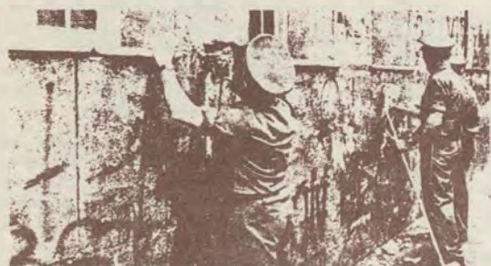
Los carteles pueden despegarse y limpiarse. Lo malo son las pintadas. La última «operación limpieza» supuso la eliminación de los carteles..., bajo los cuales aparecieron las pintadas.