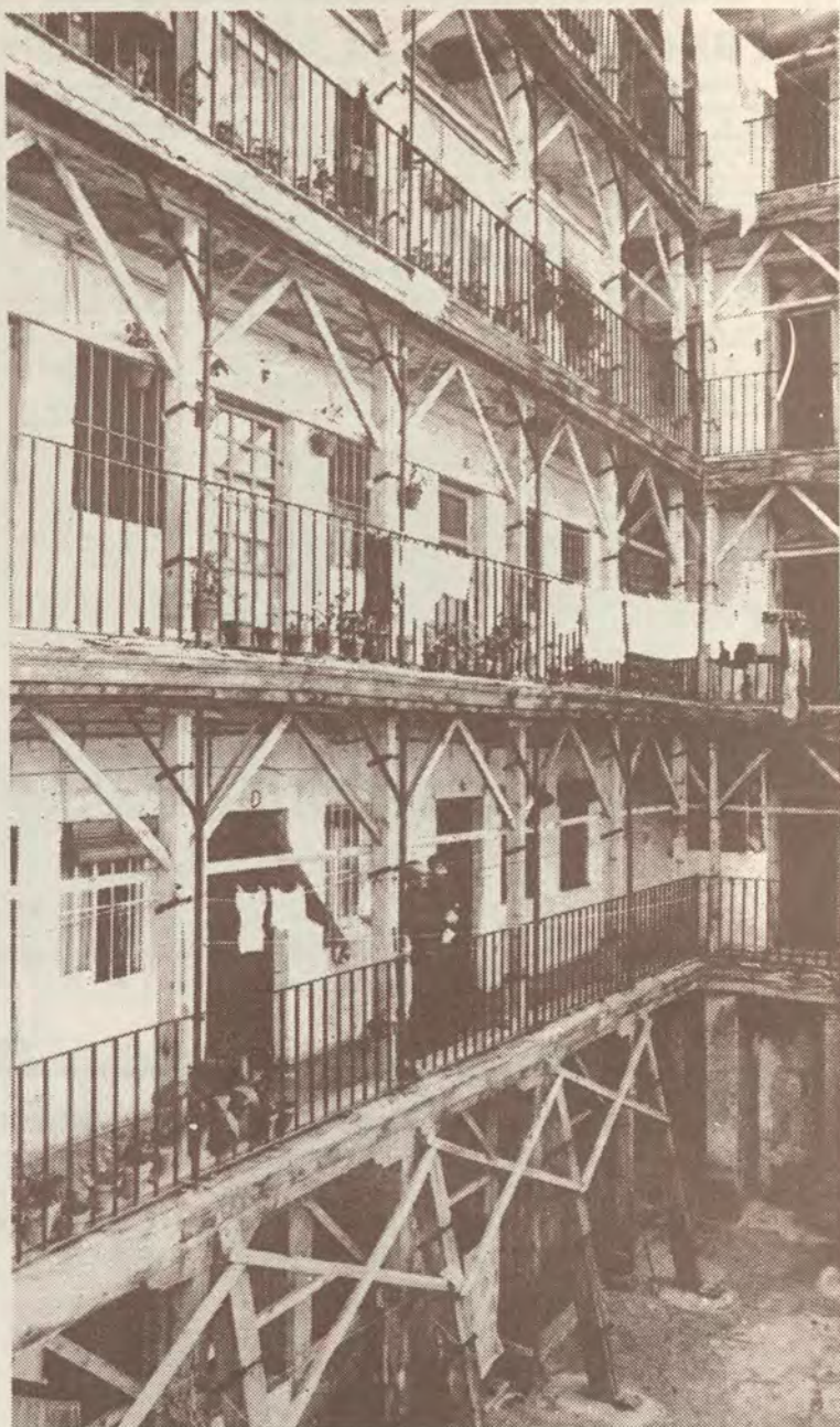
La Corrala, contrapunto popular a las colmenas de hormigón

El 12 de febrero de 1976 se volvió a visar por el COAM un expediente en el que se trataba de demostrar que el edificio no estaba en estado de ruina. Finalmente, tras casi un año, en el que el expediente de declaración como monumento histórico-artístico ha deambulado por las mesas y despachos de la Administración, ayer se supo que La Corrala ha sido declarada oficialmente como monumento para el pueblo de Madrid.