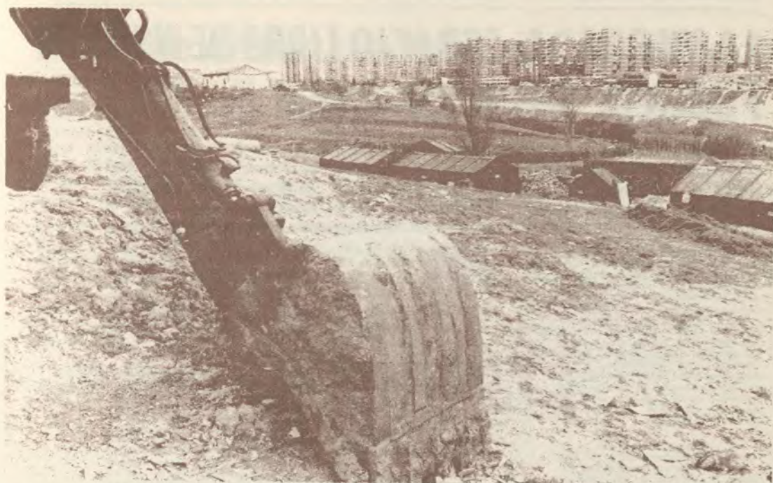
La Vaguada; el plan parcial prevé en esta zona rodeada de construcciones un gran centro comercial