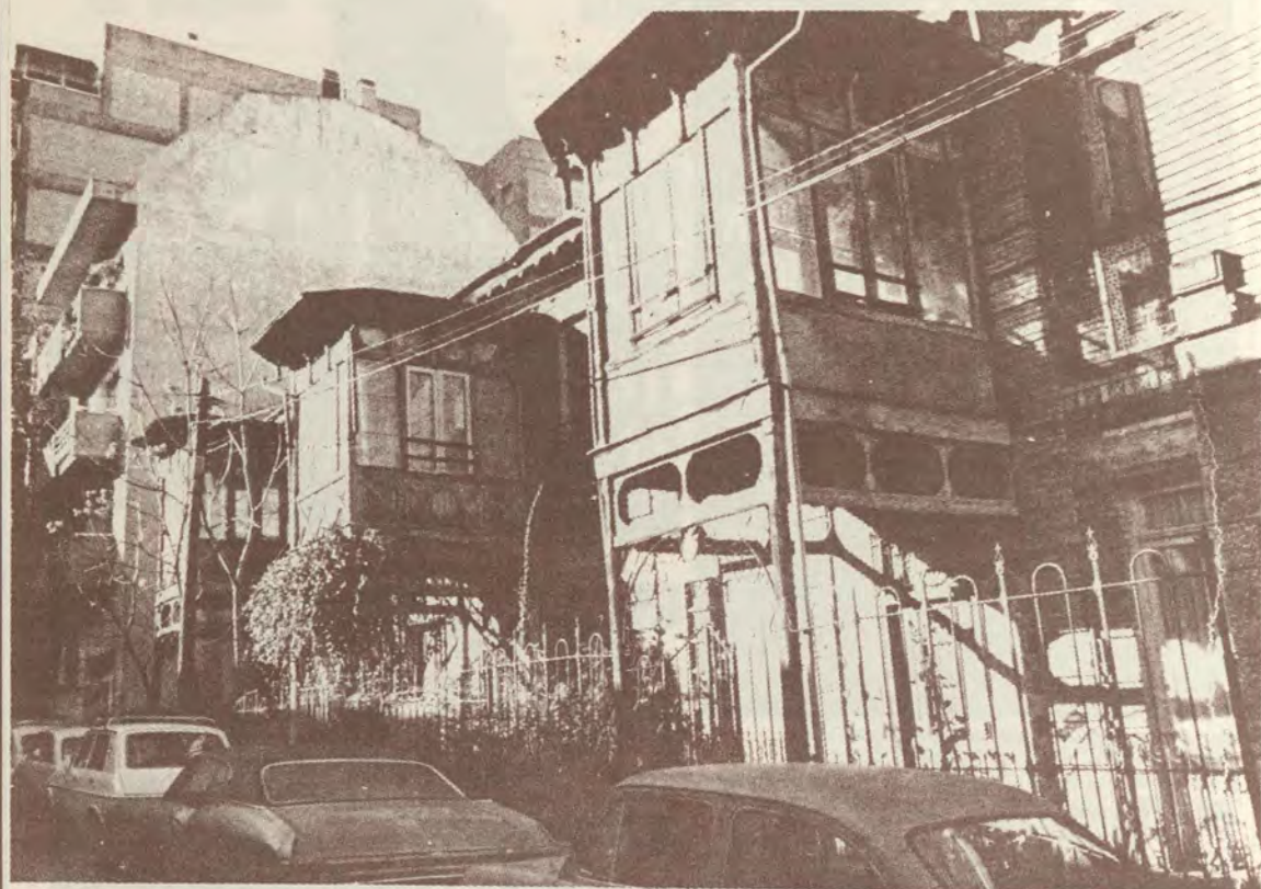
Este chalet situado en la calle de Castelar número 9, para el que se ha solicitado autorización de derribo al COAM, está integrado en un conjunto representativo de lo que se denominó art nouveau , único en la ciudad