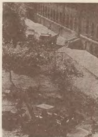
Los «bulldozers», en pleno trabajo.