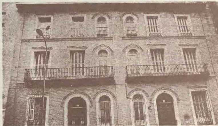
Inmueble de Zurbarán, 24, salvado de la piqueta.

La junta de gobierno aprobó entonces que todo trabajo que se presentara