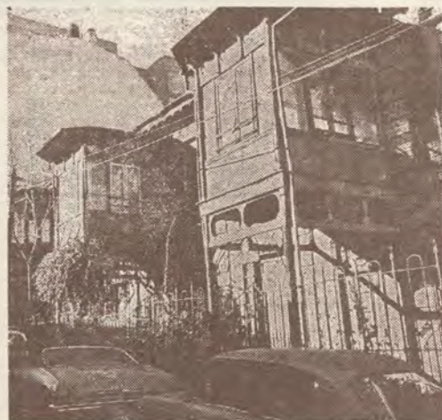
Edificio singular en la calle Castelar, 9.

Sin embargo, contra el propietario —dijeron— es necesario tomar las medidas adecuadas para que no se conviertan en lugares de especulación por la revalorización de los solares.