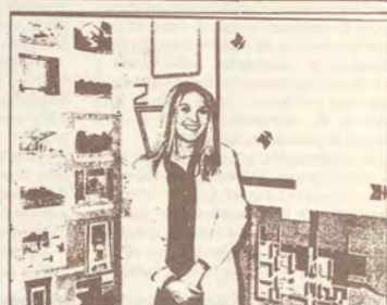
Exposición en el Colegio de Arquitectos