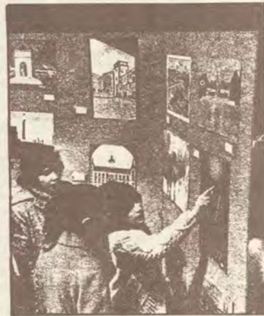
Madrid es diferente desde los ojos infantiles, quizá por los colores ausentes de la gran ciudad desde hace mucho, aunque también es tremendamente realista. Angel del Río

debatidas por la modificación polémica de la ordenanza cuarta, y que no han escapado a la curiosidad infantil, como tampoco esas estampas del oso y el madroño, asustado por el trepidante tráfico que le rodea. Hay otro cuadro muy significativo que representa la fachada principal del palacio de las Cortes, visto desde la panorámica infantil. Encima del letrero de Cortes Españolas, una visión de la Justicia, que nada tiene que ver con el auténtico bajorrelieve que luce el edificio. Se exponen también algunos dibujos que dejan entrever una buena técnica pictórica y que hablan de auténticos artistas en ciernes. La imaginación ha ju-