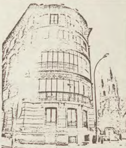
El edificio de la calle de Moreto, cuya reconstrucción da pie a la exposición