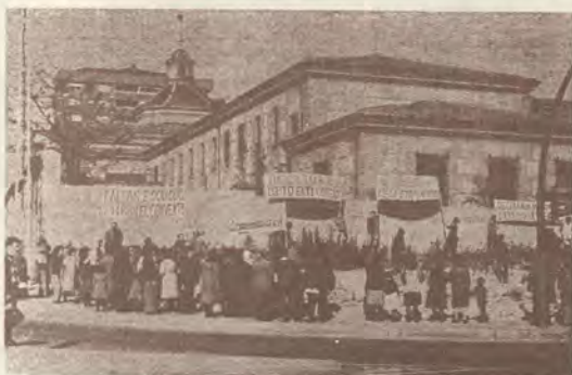
Los vecinos, pancarta en ristre, contra la demolición.

que el monumento no tenía interés y que el COAM, que es contrario a la demolición, no es un aparato estatal y, por tanto, tiene un peso relativo.