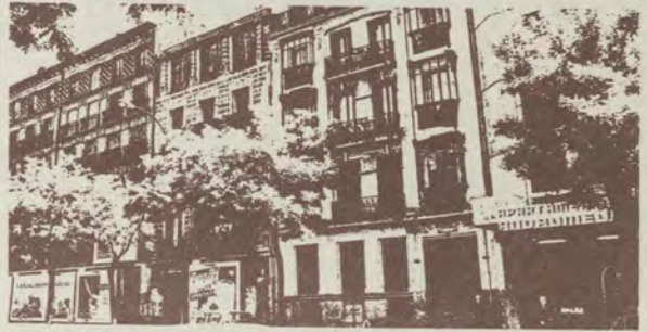
Arriba, edificios de Almagro, 14, 16, 18 y 20. A la izquierda, casa de Bárbara de Braganza, 12. Abajo, viviendas unifamiliares del siglo XIX de la calle Castelar, 9.