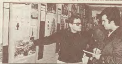
FACILIDAD PARA LA CONSECUICION DEL DERRIBO

Algo parecido ocurre con la edificación de estas construcciones destinadas a viviendas por otras que ocuparán oficinas va a provocar una densificación en la zona que, unida a la ya existente, pondrá aún más difícil la hipotética resolución de crisis que afecta a las zonas centrales de Madrid.